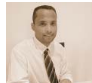
Fernando Nicarágua Osasco - SP Poesia: Feijão Indigesto