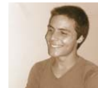
Henrique Ramalho Pontes Peruibe - SP Poesia: Caixa de Fósforos